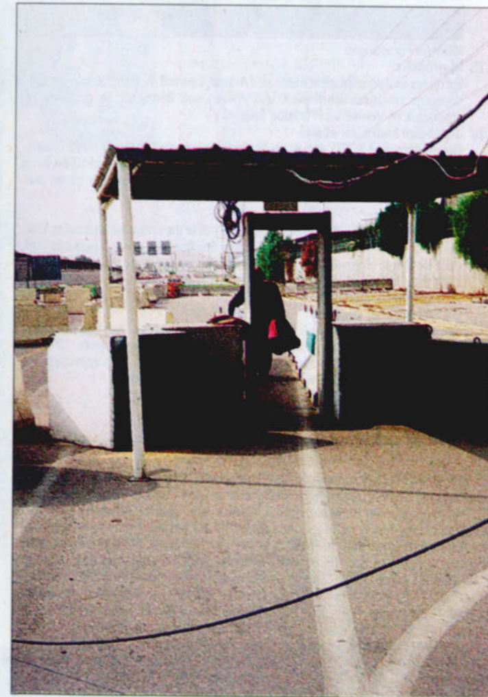
Een wegblokkade in Palestina.

(Foto: Els Opsomer, erased/vanished in 'Time Suspended')